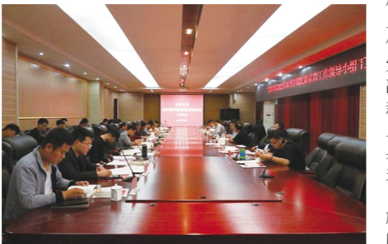
我校召开民族宗教工作领导小组工作会议