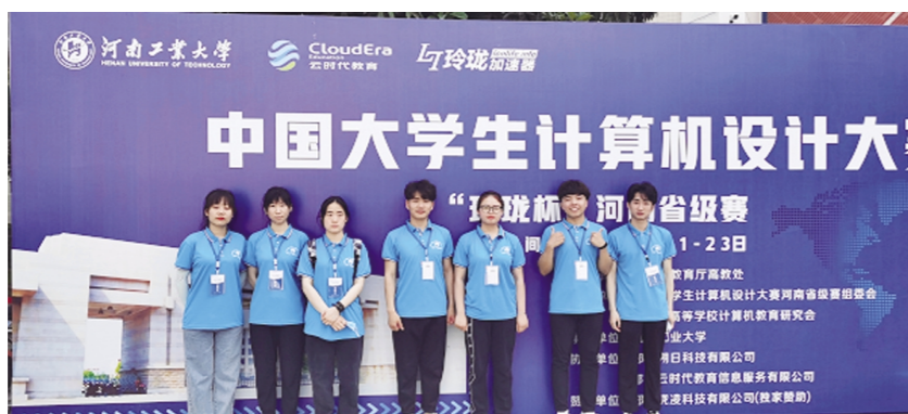
中国大学生计算机设计大赛“龙杯”河南赛区颁奖仪式

2021年第四届中青杯全国大学生数学建模竞赛已圆满结束。在学校的大力支持下,我校在此次竞赛中取得了优异的成绩。本届竞赛共有来自全国各地包括北京大学、武汉大学和复旦大学等在内等783所高校一万多名参赛者报名参加。我校共42支队伍参赛,36支队伍获奖,获奖率高达86%。其中获得全国二等奖8队,全国三等奖18队,优秀奖10队。这一成绩在省内同类院校中名列前茅。