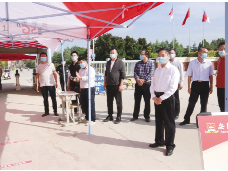
我校(原阳校区)组织召开2021级新生线上见面会

会上,各班育人导师向同学们详细解读了《致新生的一封信》,并讲解了线上报到流程、入学教育、线上教育等后续工作安排和注意事项,激发了同学们的学习热情。本次见面会的成功举办,拉近了新生与育人导师之间的距离,同时也为新生更好地规划大学生生活提供了借鉴,指明了方向。(文/闫萌)